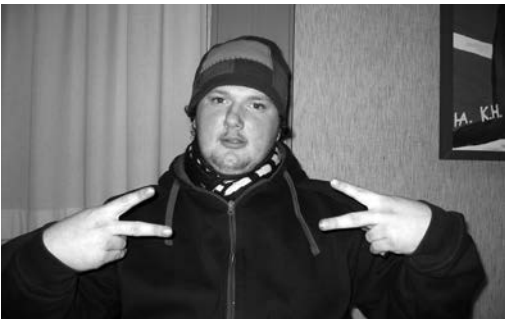
»What's up?«, Jugendhilfe Herzogsägmühle

Für uns waren der Kurs und die Rückmeldung der Teilnehmenden in jedem Fall eine große Ermutigung, über weitere Projekte dieser Art nachzudenken.